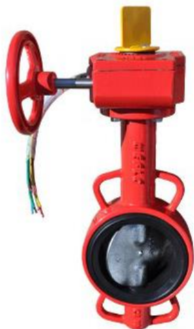
Затворы дисковые поворотные FIG 2304-TG