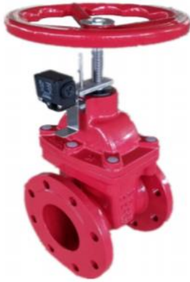
Задвижки клиновые фланцевые FIG 3276S