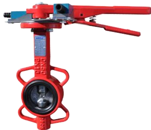
Затворы дисковые поворотные FIG 2304-L-S